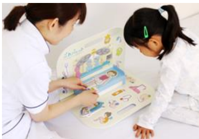
「ふれパレット」を使った医療行為の説明（イメージ）

「子どもたちが安全に、そして安心して暮らす」「子どもたちが感性や創造性豊かに育つ」「子どもを産み育てやすい社会をつくる」という目的を満たす、製品・サービス・空間・活動・研究の中から、子どもや子育てに関わる社会課題解決に取り組む優れた作品を顕彰するものです。（主催：特定非営利活動法人 キッズデザイン協議会、後援：経済産業省、消費者庁、内閣府）