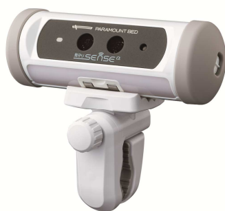
見守りSENSE αシリーズ 赤外線センサー 「NN-3321」