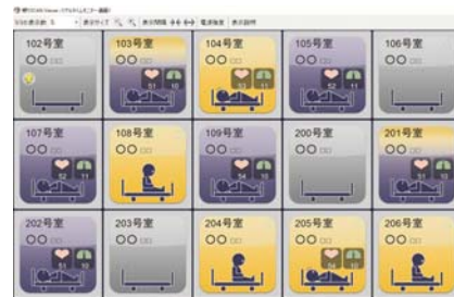
PC 端末での表示例。遠隔で利用者の状況が一元管理できる。

お客様 お問い合わせ先 パラマウントベッド(株) IBS 販売推進部 TEL:03-3648-1077 FAX:03-3648-5466